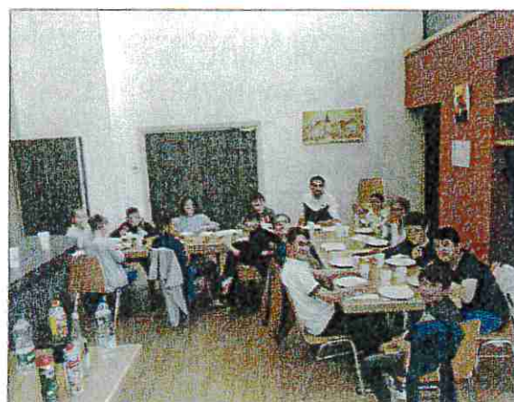
SOIREE PIZZA-GAROU du 6 mai 2022